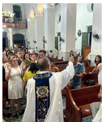
Sé Catedral de Nossa Senhora da Conceição

A comunidade local realizou um café partilhado após a