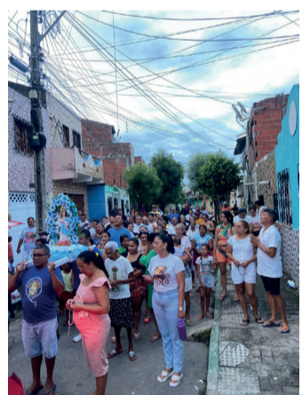
Capela da Misericórdia – Bairro Tamarindo