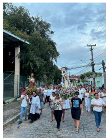
Capela São Pedro – Bairro Dom Expedito

Thais Helena - Redação Jornal Correio da Semana