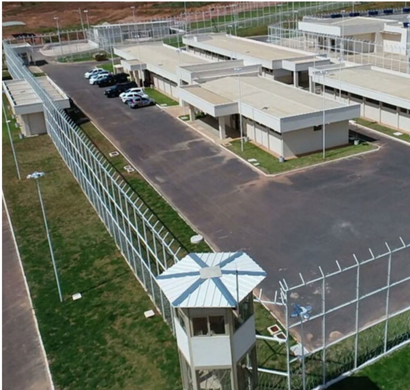
Em 2022, 57,2% dos moradores de domicílios coletivos estavam em penitenciárias e 19,2% em asilos.