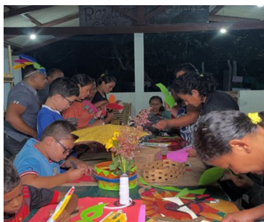
Oficina de confecção de mascarás carnavalescas no Sítio São Vicente - ACSM