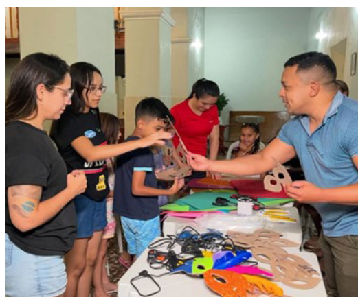
Oficina de confecção de mascarás carnavalescas na Palestina do Norte - ACM