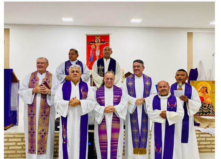
Presbíteros com faixa etária a partir de 31 anos de Ordenação Presbiteral