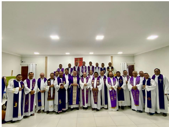
Presbíteros com faixa etária de 6 a 15 anos de Ordenação Presbiteral