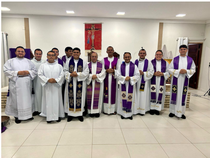
Estagiários e Presbíteros com faixa etária a partir de 0 a 5 anos de Ordenação Presbiteral