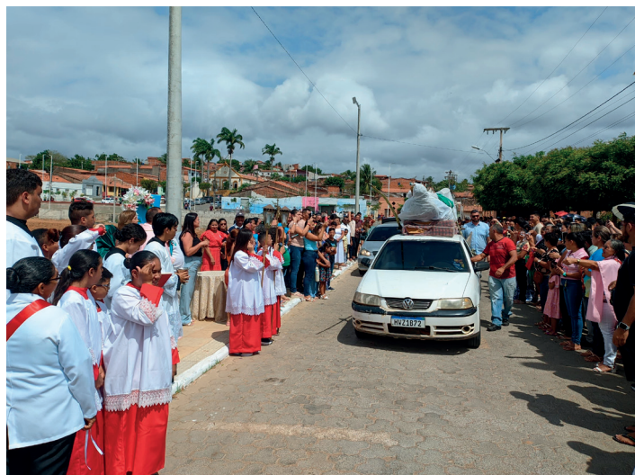
IMAGEM DE NOSSA SENHORA DA SAÚDE É ABENÇOADA E INSTALADA EM JORDÃO