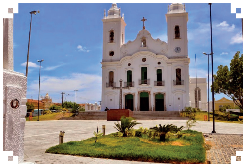
Igreja da Sé, Igreja Matriz de Sobral