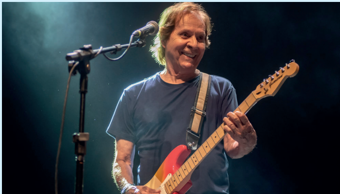
Artista mineiro Beto Guedes fará show durante o evento com acesso gratuito

Definida programação do Festival Jazz & Blues na 27ª edição no Carnaval 2026, de 14 a 17 de fevereiro, em Guaramiranga. Nos palcos, atrações cearenses, nacionais e internacionais com sons que passam por gêneros afins, regionais e outras vertentes da música brasileira.