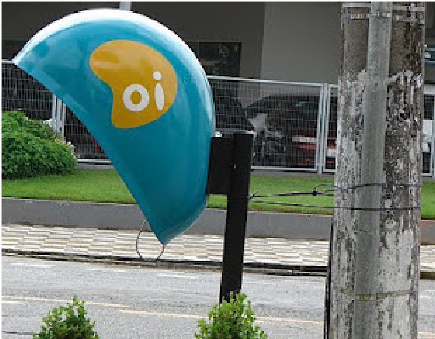
Orelhão localizado na Rua Uchôa Filho, próximo a Unesp de Presidente Prudente (SP)

Em Sobral, existem 4 orelhões da operadora Oi.