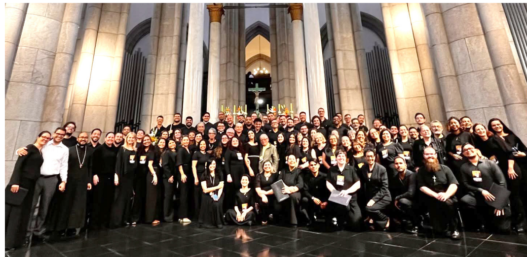
Líderes de música, cantores, regentes e organistas de 50 dioceses do Brasil na Catedral de São Paulo