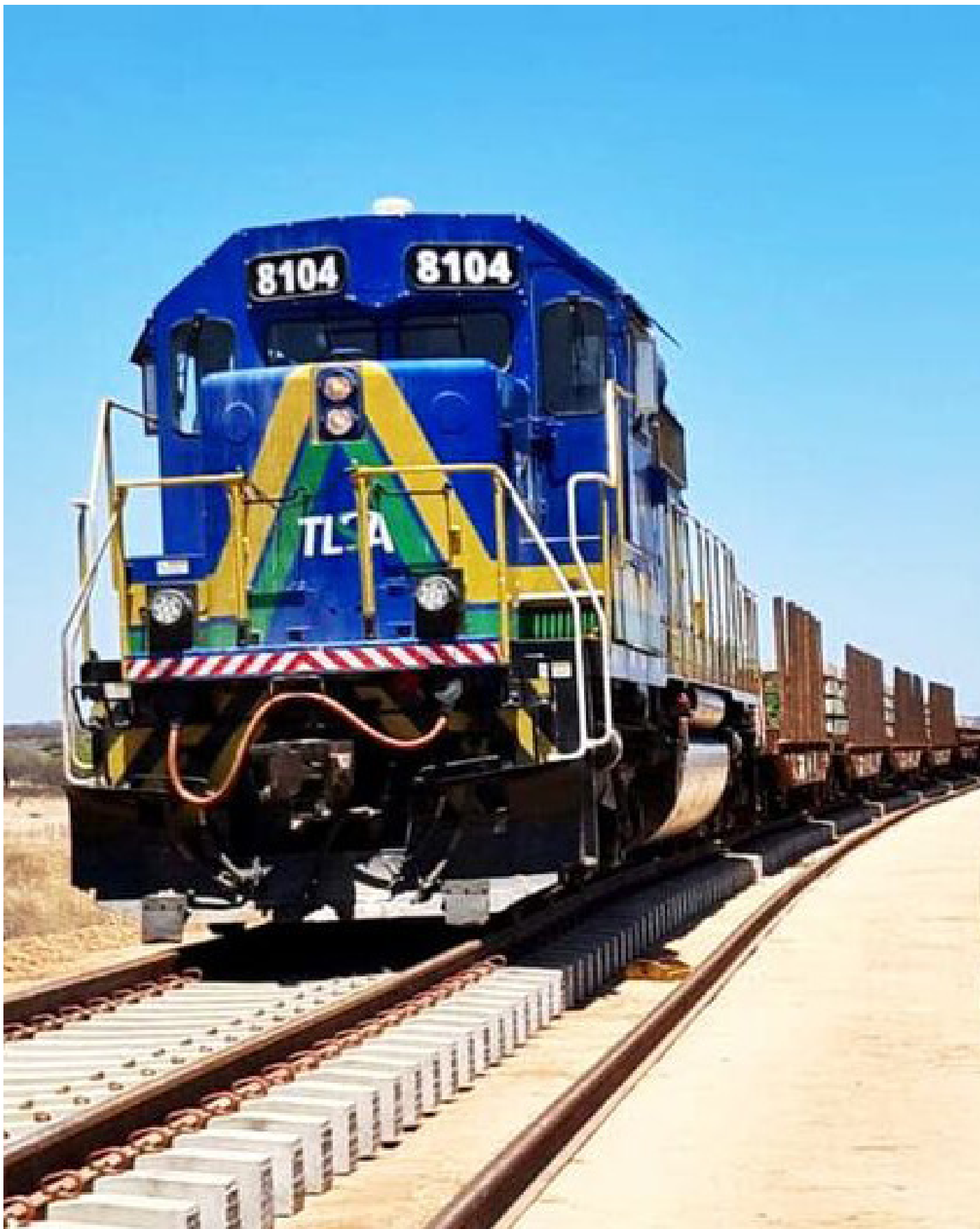
Imagem: reprodução/melhorada com ajuda de inteligência artificial

O município de Iguatu vai ter um terminal de distribuição de combustíveis. A estrutura será instalada dentro do Terminal Logístico de Iguatu (TLI) e vai funcionar para receber, armazenar, movimentar e distribuir grandes volumes de combustíveis.